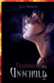
Verführung der Unschuld 2